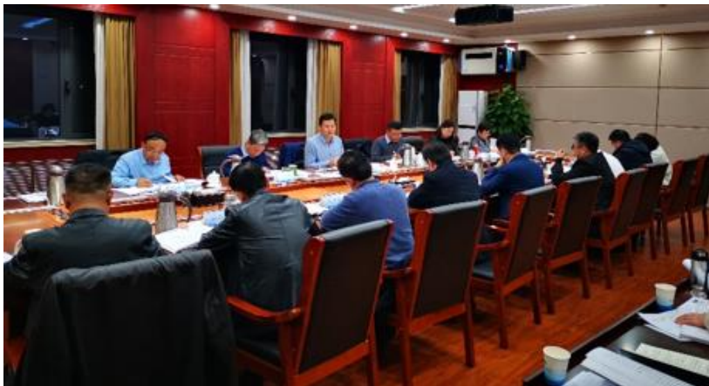
图 10：审核评估领导小组讨论自评报告（2024 年 1 月 16 日）

2024 年 1 月 16 日，审核评估领导小组召开会议，对学校自评报告第二稿及《本科教育教学质量保障体系建设及实施办法》《关于加强研究性教学培养学术型人才指导意见》两个文件进行讨论。