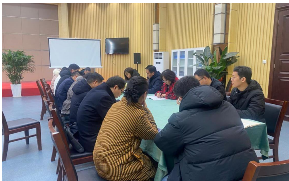
图 5：评建办公室召开工作例会（2024 年 1 月 2 日）

2024 年 1 月 2 日，评建办公室全体成员在第四报告厅召开工作例会，全体成员就近期工作进展进行详细汇报，讨论研究了相关问题的解决方案，并就评建办公室重点任务开展部署。