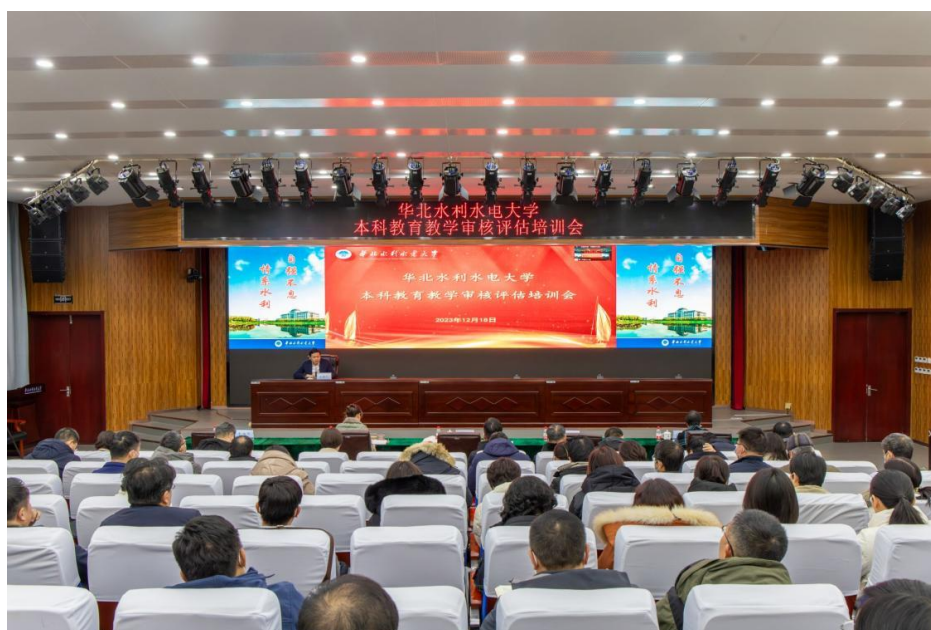
图 2：我校组织召开新一轮本科教育教学审核评估全员培训会（12.18）

12 月 14 日，评建办公室全体成员在第四报告厅召开工作例会。会议研究了各工作组上一阶段工作开展情况，就自评报告初稿统稿、支撑材料收集、常模数据分析、审核评估系统上线等工作继续推进开展详细部署。