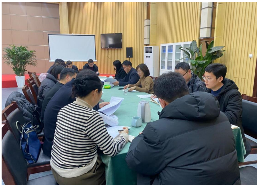
图 7：评建办公室召开工作例会（2024 年 1 月 12 日）

自评报告组连续集中开展自评报告统稿工作，支撑材料组整理形成自评报告第三轮支撑材料目录清单。