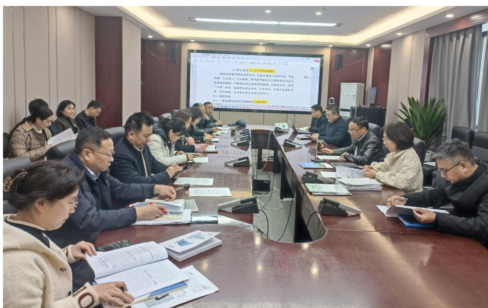
图 6：各项目组开展自评报告研讨工作

2024 年 1 月 2 日，评建办公室全体成员在第四报告厅召开工作例会，全体成员就近期工作进展进行详细汇报，讨论研究了相关问题的解决方案，并就评建办公室重点任务开展部署。