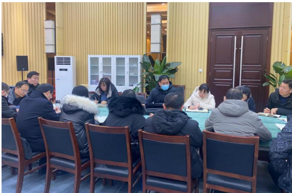
图 1：评建办公室召开工作例会（2023 年 12 月 14 日）

12 月 14 日，评建办公室全体成员在第四报告厅召开工作例会。会议研究了各工作组上一阶段工作开展情况，就自评报告初稿统稿、支撑材料收集、常模数据分析、审核评估系统上线等工作继续推进开展详细部署。